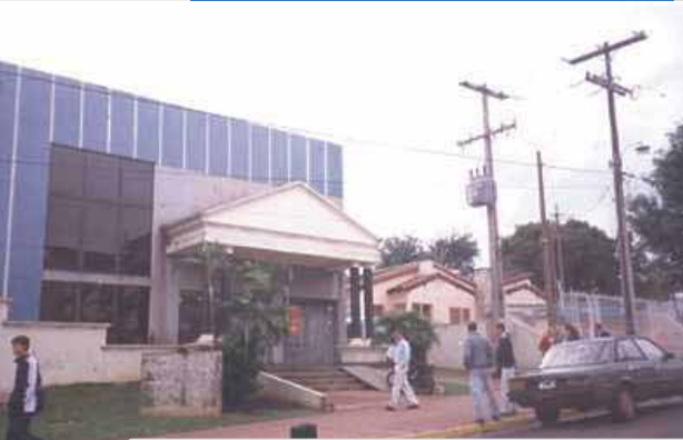
Local donde se instalará la delegación de Encarnación