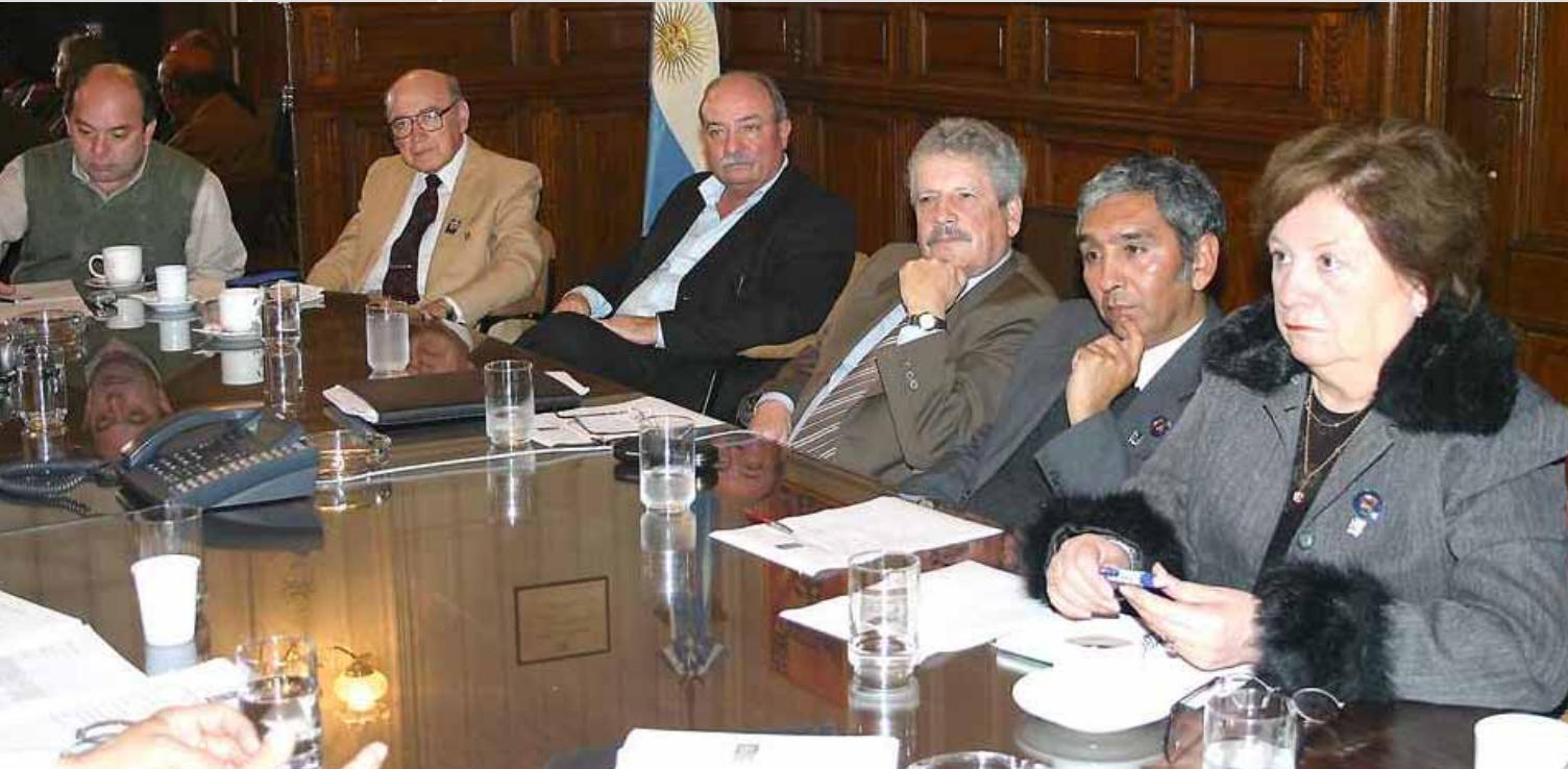
REUNION COMITE DIRECTOR