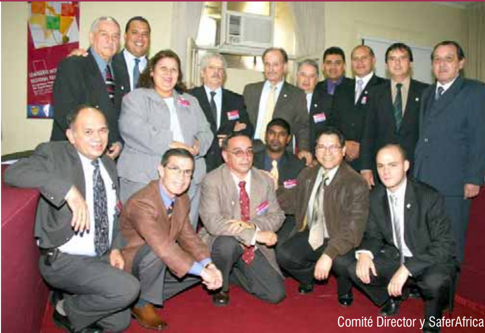
Comité Director y SaferAfrica