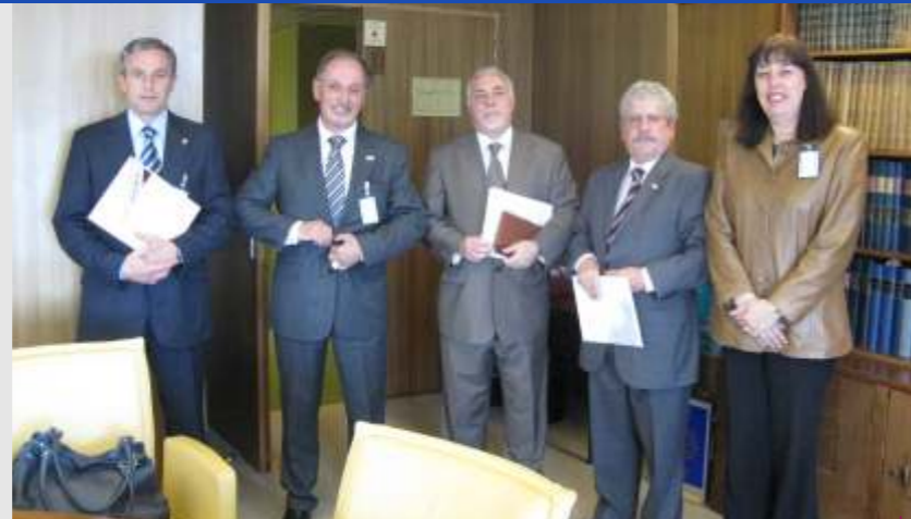
El grupo de Odema en Ginebra con Castro Fox

Este nuevo paso le posibilitará a las mutuales americanas el acceso a las diferentes corrientes en materia de protección social, comparando experiencias, intercambiando informaciones y discutiendo sobre los problemas respectivos de cada país. Al mismo tiempo tendrán acceso al desarrollo de la seguridad social en el ámbito internacional, a los resultados de sus investigaciones y a la asistencia técnica y de formación del personal dedicado a la salud.